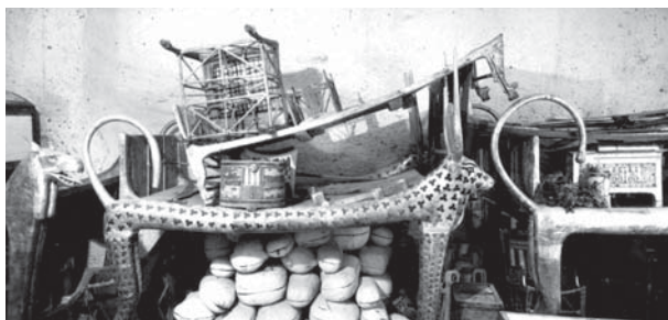
Pohled na rituální předměty v předsíni

Howard Carter se domníval, že Tutanchamonovu hrobku najde pod ruinami chatrčí starověkých stavitelů, které byly v Údolí králů vybudovány v souvislosti se stavbou hrobky faraona Ramsese VI. Hrobka byla umístěna ve skále a skládá se ze čtyř místností.